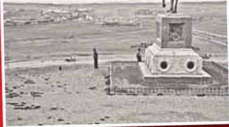
Etnografya Müzesi önündeki Atatürk Anıtı, Ankara, 1927 civarı

vinen Şehirler - Basın Fotoğrafçıların Gözünden Ankara, Belgrad, İstanbul, Saraybosna" sergisi, 23 Mayıs - 29 Temmuz günlerinde Yapı Kredi Kültür Sanat 'ta sanat-severleri ağırlayacak. Sergi , Osmanlı'nın yıkılışından sonra kurulan Türkiye Cumhuriyeti ve Yugoslavya Krallığı'ndaki dört şehirde; Ankara, Belgrad, İstanbul ve Saraybosna'daki basın fotoğraflarından oluşu-