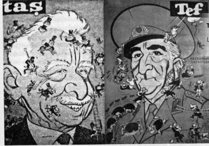
Tas 18 Aralık 1958 (solda); Tef, 21 Temmuz 1960 (sağda).

“Muhalefet Defteri: Türkiye’de Mizah Dergileri ve Karikatür” yedi bölümden, yedi güçlü makaleden oluşuyor. İki ismin 2007’den bugüne yaptığı yayın ların gözden geçirilmiş/yenilenmiş ve bütünlüklü hale getirilmiş cildi, YKY