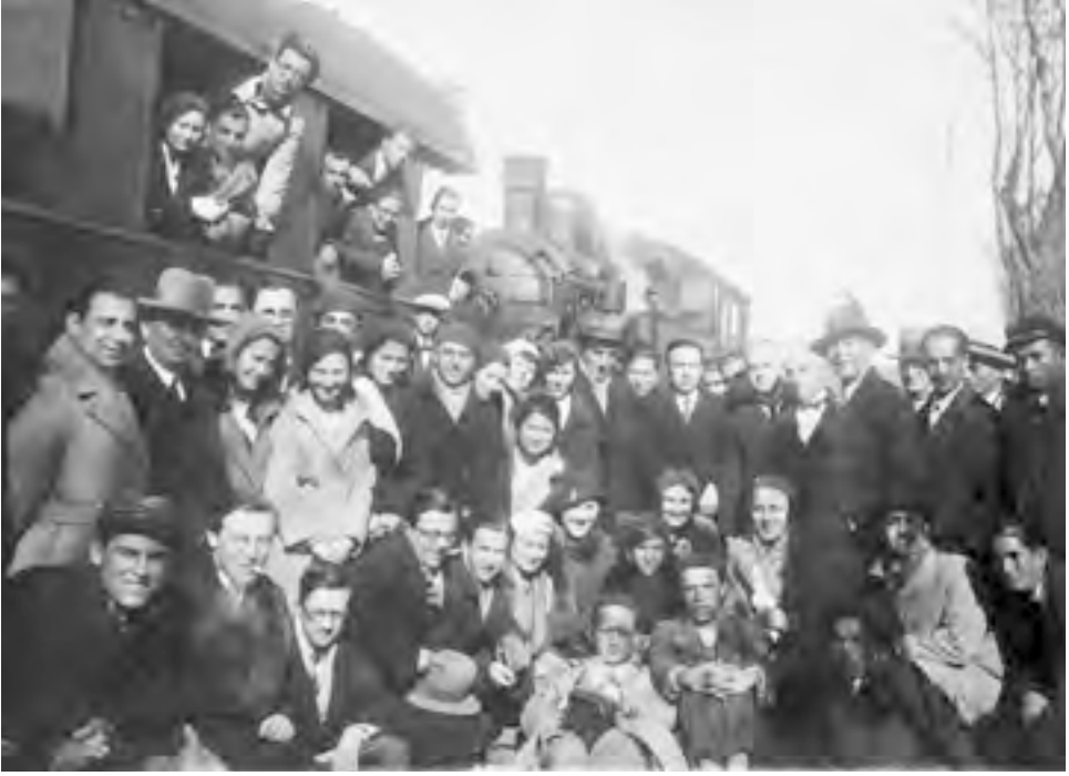
Adana-Mersin-Tarsus inceleme gezisine katılanlar

Grup Konya'ya geldiğinde Sabahattin Ali'yi de alarak yolculuğa devam eder.