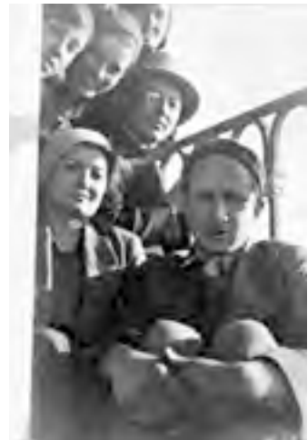
Adana'da Ramazanoğulları Camii'nin minaresinde