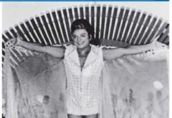
Deniz kenarında ya da havuz başında fotoğraf çekimeyi çok sevdi.