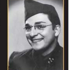
Sünnet olduğunda ellerine kına yapamaları için direttiği, onun yerine oje sürdüştürmüştü.

ALI POYRAZOĞLU "Tiyatroya uğurlu gelirdi, ilk bileti almamış gününü çagırdık" ZEKİ Müren çok iyi bir tiyatro takipçisiydi. Uğurlu da gelirdi, ilk bileti almamış gününü çagırdık. O da bizi karmazdı. Çok derin toplu bir adammış, sanatçı çok saygı gösterirdi. Çuğu bosa, kavatçı, hali tavı... Özgürlük hakları, çok özelliği vardı. Tiyatro kurduğumuz zaman ilk oyunumuz Aziz Nesin'in "Hakkımı Ver Hakkı"nın da ilk bileti almamış. Eli çok ağırduymuş, 40 yıldır seçmiş sakımsız ekimiyorum.