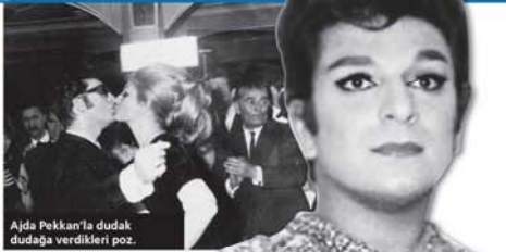
Ajda Pekkan'la dudak dudaga verdikleri poz.