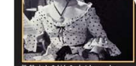
İlk filminde Cahide Sonku'yla oynadı.

hazırlanıyor olur ya... Zeki Müren de bir yıldız olmaya öyle hazırlanmış ve sonunda da olmuş. ● Akademi'de tekstil deseni bölümüne giriyorduk epey meşhur. Buna rağmen dersleri çok ciddiye alıyor ve çok basarılı oluyor. Bir sergisinde sahneye 100 kadar deseni koyuyor. Perde kalkınca izleyiciler bir süre deseni izliyor, kendisi sahneye daha sonra gelmiş. ● Bir gün hocası bir deseni bakıyor, "Bunu nasıl yaptın?" diye soruyor, tekniğini anlatıyor. Meğer kadının poposuna boya sürüp izliyor, kendisi sahneye daha sonra gelmiş. ● Ben yapmadım, Tekir yaptım" diyor.