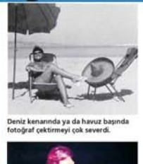
Deniz kenarında ya da havuz başında fotoğraf çekimeyi çok sevdi.