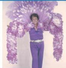
Deniz kenarında ya da havuz başında fotoğraf çekimeyi çok sevdi.