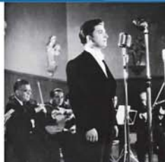
Sahneye inmek için kullandığı sahnaktan, fonda köpüklerin aktığı hareketli dekorlara kadar detaylarını filmiyle verdi. Sahne dekorlarına "Aşk Sarayı", "Kağı Gölündeki Sır" gibi isimler veriyordu. Kostümlerine verdiği isimler de şarkı isim gibi gazino ilanlarında sıralanıyordu: "Susamın İstiyeyim", "Yakut Kadehi", "Şampanyanın Rüyası".