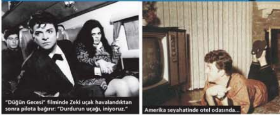
"Düjün Gecesi" filminde Zeki uçak havalandıktan sonra pilota bağırır: "Durdurun uçağı, iniyoruz." Amerika seyahatinde otel odasında...