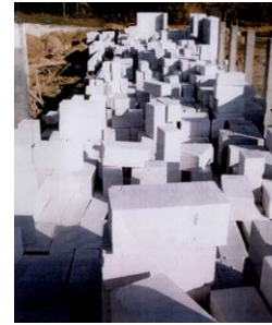
İnşa edilen şey olarak Boşluktaki Beyaz Ev White House in the Emptiness as the constructed thing 2002

Another thing I noticed was that despite the attractiveness of its conceptual aspect, the state of being “the constructed thing”, which we can call the “tangible essence of architecture” was always in the forefront for me. Concepts, I realized, either emerge from this tangible essence or remain there, right inside of it.