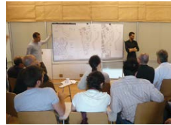
Mimari Tasarım Yüksek Lisans Programı Graduate Program in Architecture 2004