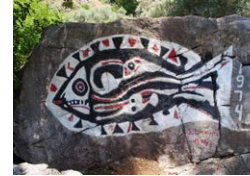
Bedri Rahmi'nin "Mavi Yolculuk" izlerinden Bahk Fish from the traces of the "Blue Cruise" 1974