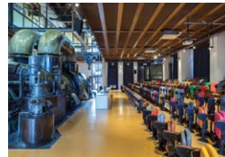
Hukuk Fakültesi Faculty of Law 2017