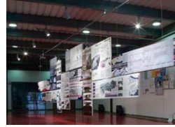
İstanbul Bilgi Üni. İstanbul Bilgi Uni. Dolapdere 2004