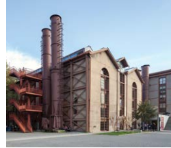
Mimarlık Fakültesi Kazan Daireleri Faculty of Architecture Boiler Houses 2014