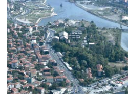
Silahtarağa Elektrik Fabrikası Silahtarağa Electricity Power Plant 2004