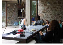
Yahşibey'de mimarlık yaz okulu Architecture summer school in Yahşibey 2004