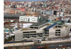
Gön Deri Fabrikası 2 Gön Leather Factory 2 2005